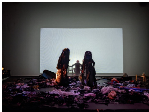
Essais scénographiques @La Friche Belle de Mai | Marseille