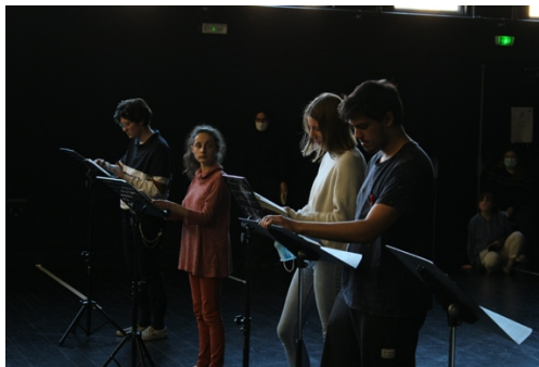
Ateliers à l'Université d'Aix en Provence

Il n'est pas inutile de préciser qu'ici, une grande place sera faite à l'absurde et à l'humour.