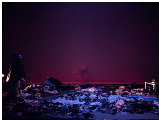
Essais scénographiques END ? @La Friche Belle de Mai | Marseille

Il nous semble important d'ouvrir le débat avec les enfants, notamment sur les gestions possibles de la crise climatique et des manières de protéger le vivant. De quel « vivant » s'agit-il ? De tous les vivants ou d'une poignée de chanceux ?