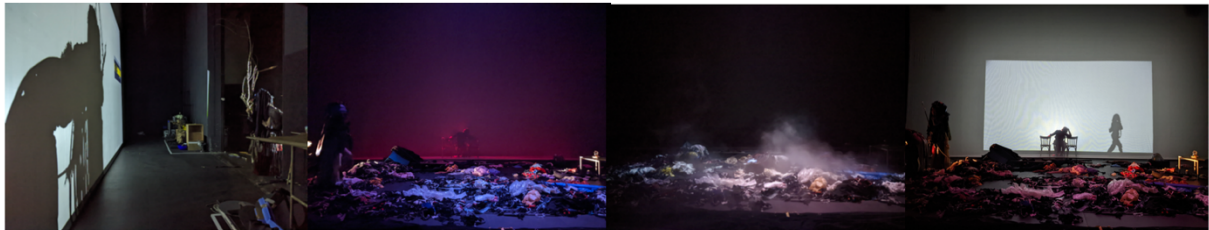
Essais scénographiques END ? @La Friche Belle de Mai | Marseille

Une partie de ces éléments a été collectée lors de précédentes répétitions sur un projet en collaboration avec l'ISTS à Marseille. Il s'agissait d'un travail de fin de formation pour des régisseur·euse·s, et nous avons décidé de garder tous les plastiques générés par les trois groupes de travail, soit environ quarante-cinq personnes ; nous avons pu couvrir un plateau entier au bout de trois semaines de travail. Ces éléments ont été stockés en vue de la création du spectacle Pépin , dont voici les premiers essais scénographiques.